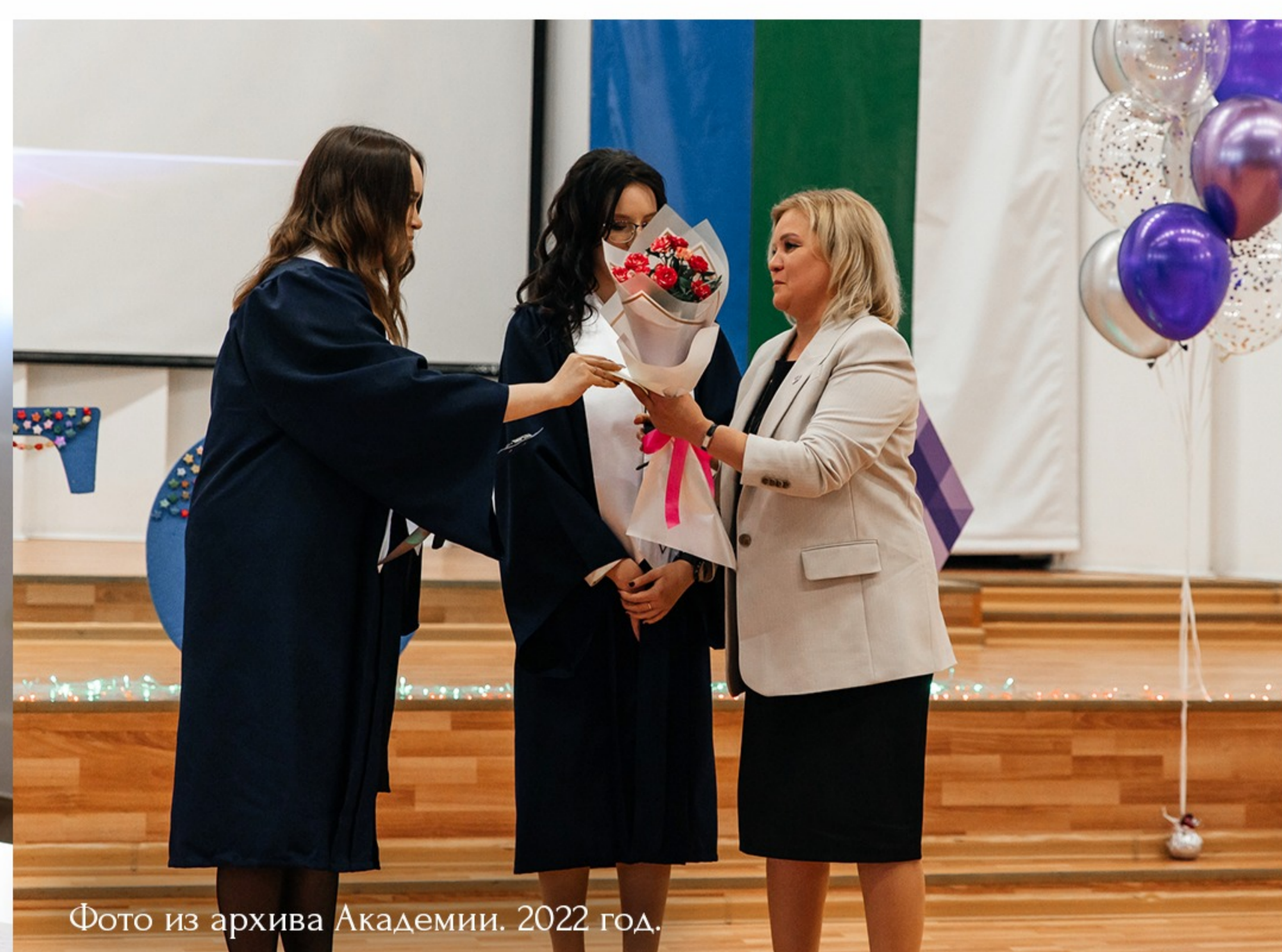
2022 год.