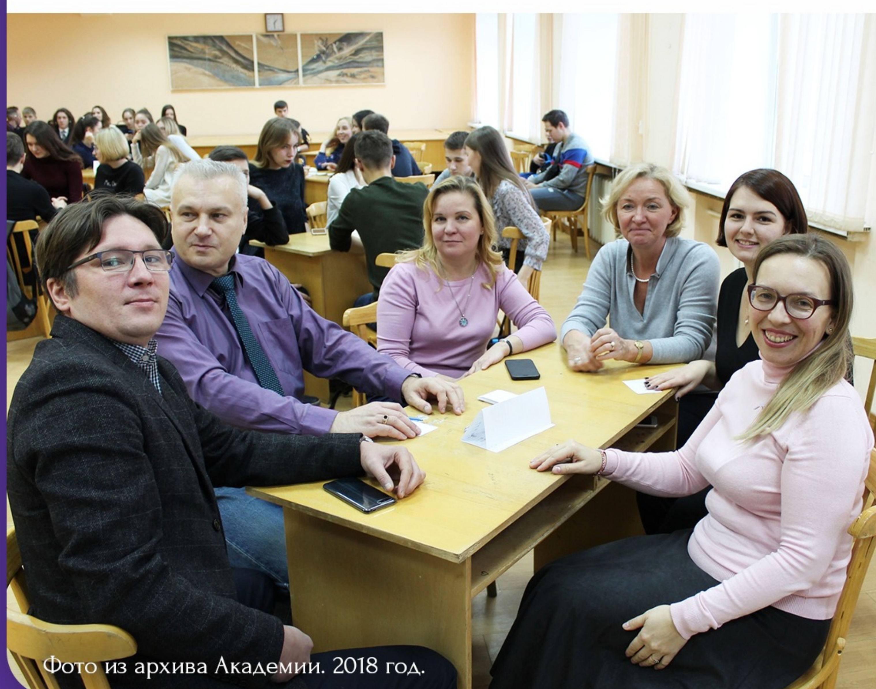
2018 год.