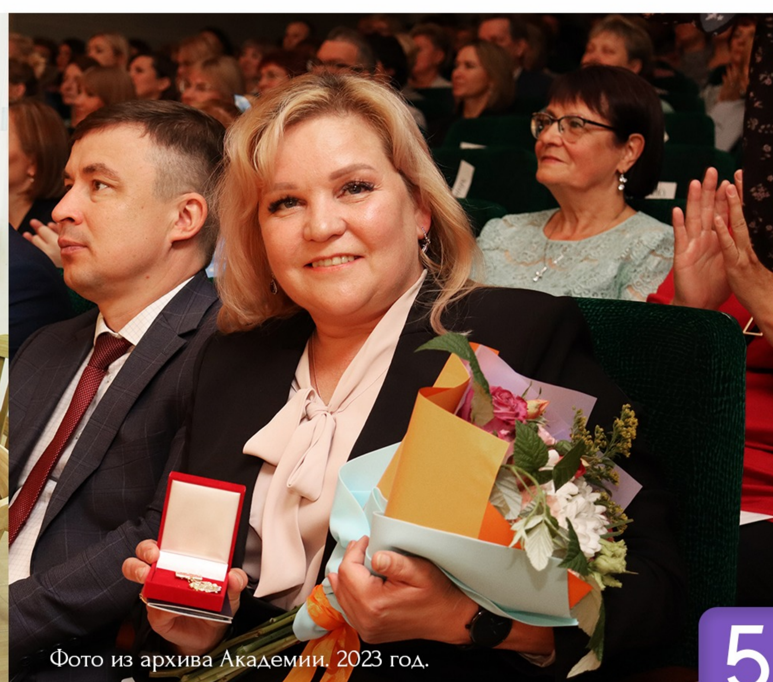
2023 год.