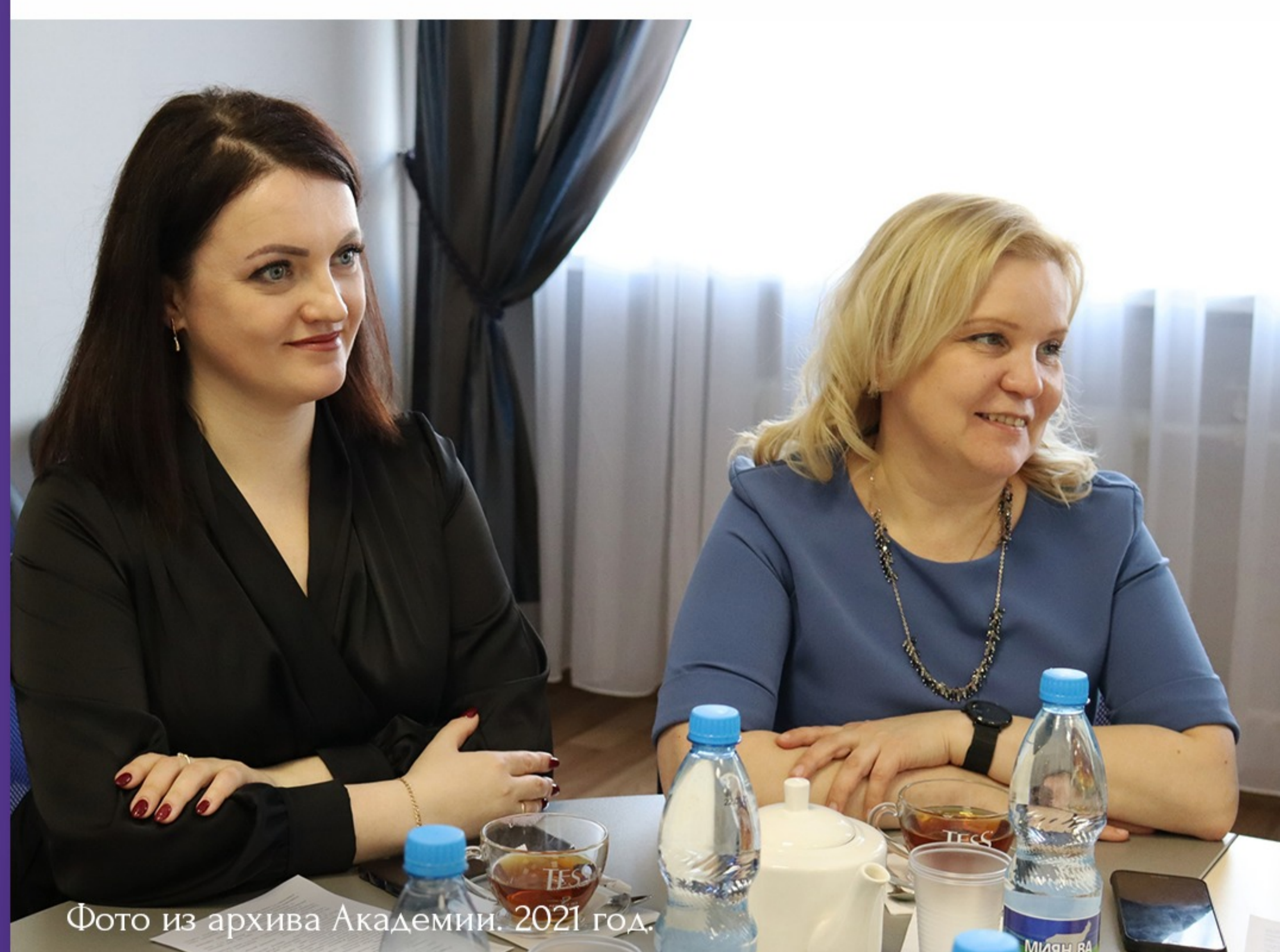
2021 год.